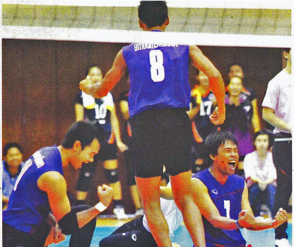
ลูตู่ ๑ บรรดาพลพรรคทีมนักตบลูกยางหนุ่มสถาบันการพลศึกษาสุดดีใจหลังตบชนะแชมป์เก่าอย่าง ม.รัตนบัณฑิต คว้าแชมป์ไปได้

“เราต้องชื่นชมเด็กด้วยที่เล่นได้ตามแผนที่วางไว้ ทั้งเรื่องของการบล็อกบอล ที่เราวางแผนไว้และเด็กก็ทำได้ยอดเยี่ยม รวมถึงการ